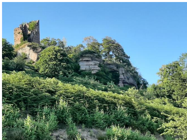
Château de Salm

Départ ; Pierre-Percée Barrage du Vieux Pré